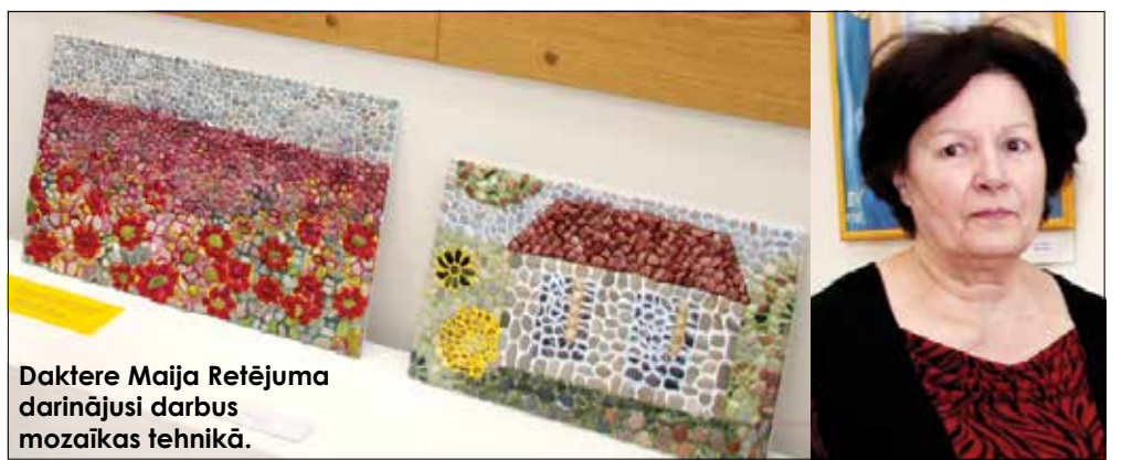
Daktare Maija Retējuma darinājusi darbus mozaikas tehnikā.